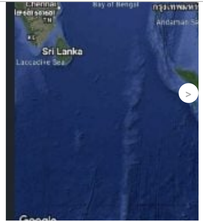
【独家】昔加末地震|柔昔市停震11天 15分钟前 1.4千点阅