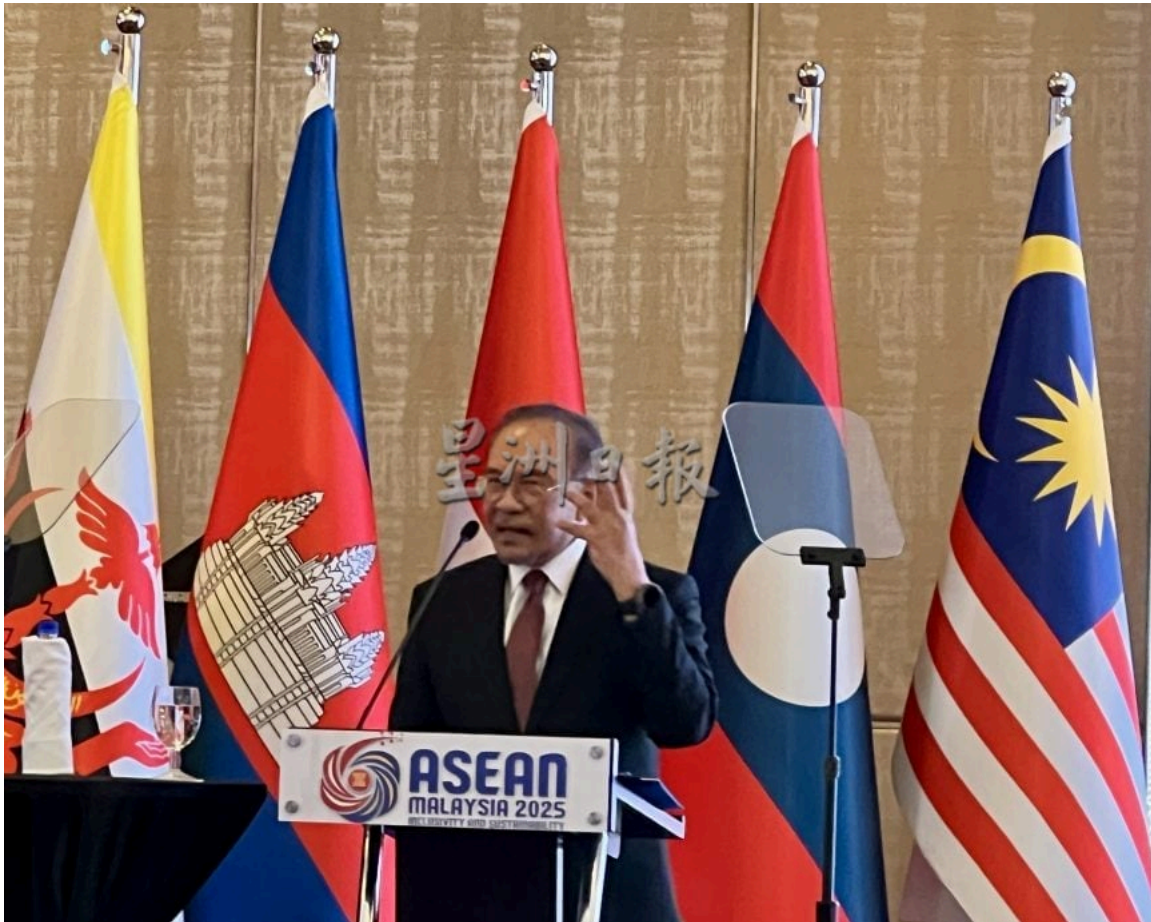
安华：“互相信任、合作与共同责任”是东盟持续发展的根基。