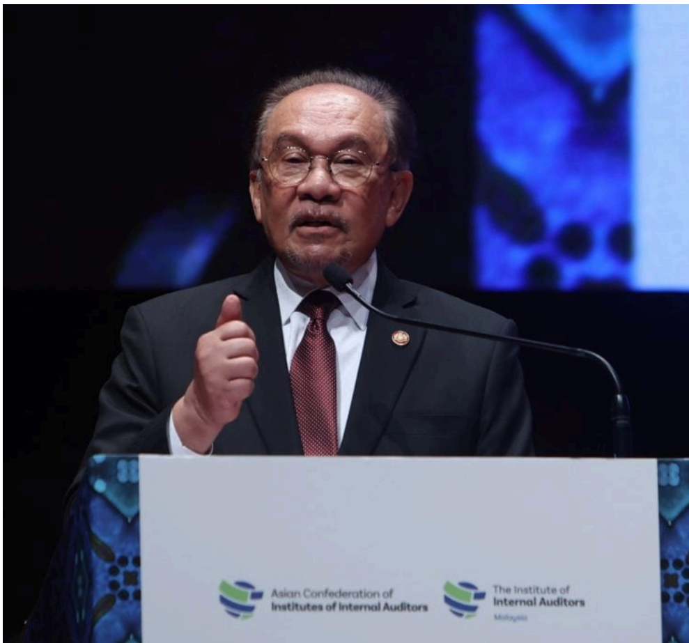
安华说，良好治理应被视为策略资产，而非负担。

（吉隆坡9日讯）首相拿督斯里安华说，良好治理应被视为策略资产，而非负担，因它不仅是市场信誉的基石、吸引投资的磁铁，也是在发展中实现公平共享的保障。