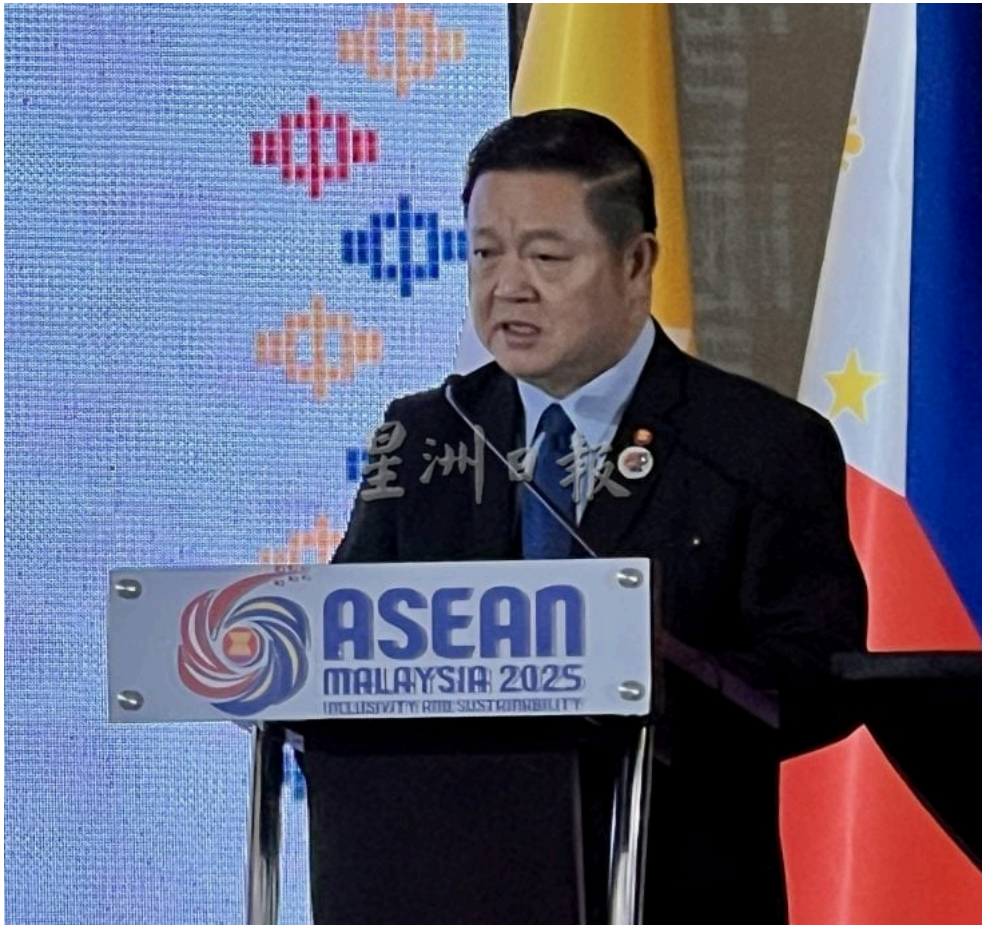
东盟秘书长高金洪博士。

赛夫丁也表示，外界关注的泰国与柬埔寨之间的边境冲突，将不会影响东盟在跨国犯罪上的合作，他强调，之前在吉隆坡举行的特别跨境会议已展现东盟成员国在安全议题上的紧密合作与信任。