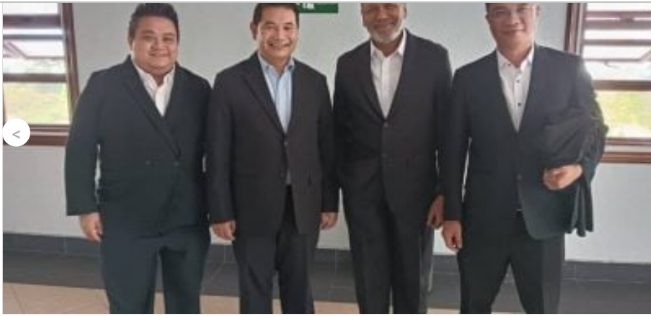
一撤贴一撤诽谤诉讼 拉菲兹 端依布拉欣 和解 13分钟前 146点阅