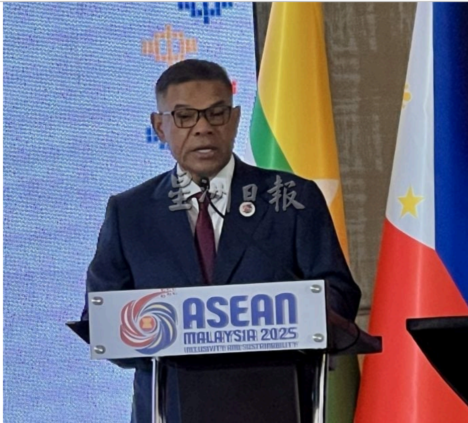
内政部长拿督斯里赛夫丁。